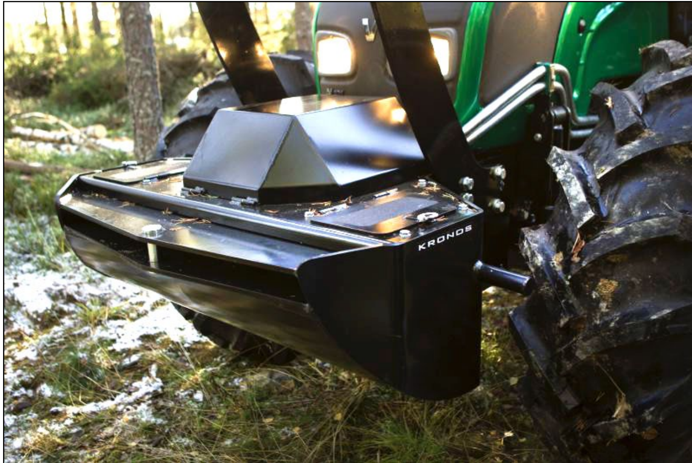
KRONOS 160 N-series